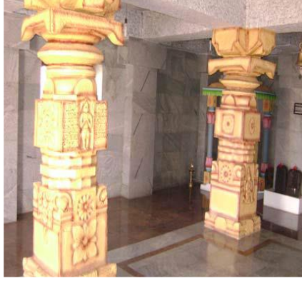
ವೀರನಾರಾಯಣ ದೇವಾಲಯದ ನವರಂಗ