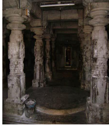
ಮಲ್ಲಿಕಾರ್ಜುನಸ್ವಾಮಿ ದೇವಾಲಯದ ನವರಂಗ